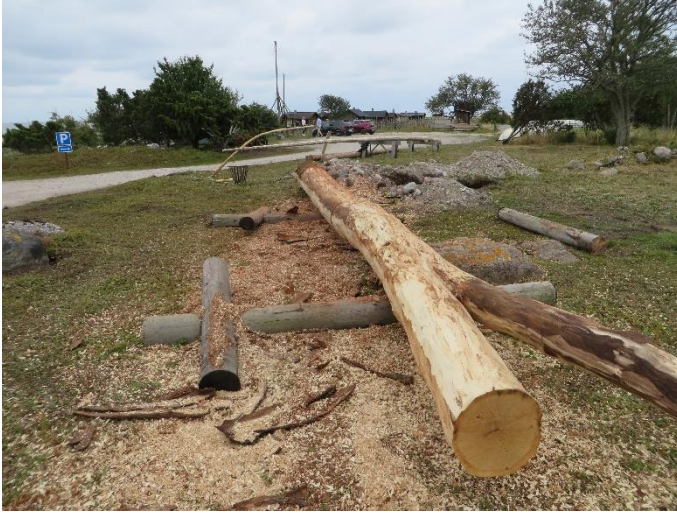
Barkning av ekstocken till stammen

Ansvarig för aktiviteten var Föreningen Tomtbods fiskeläge.