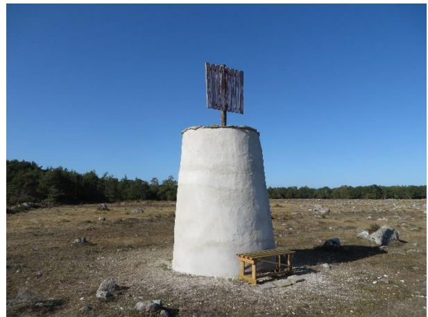
Kumlet nyputsat 2019