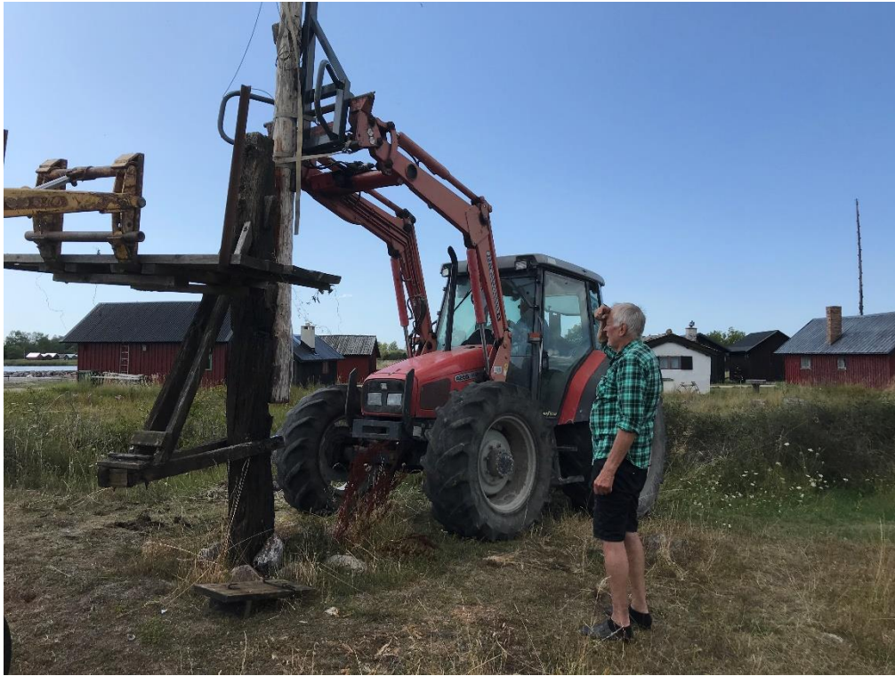
Janne kollar att den reses lodrätt

Ansvariga för arbetena var Hus hamnrätt.