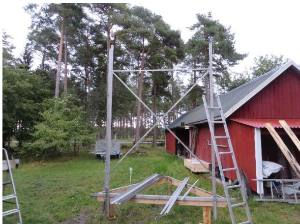
Hela stativet provmonterades i land