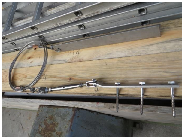
Fästena till stativet

Hela konstruktionen monterades sedan isär och transporterades ut till Austergrund 2019-10-08