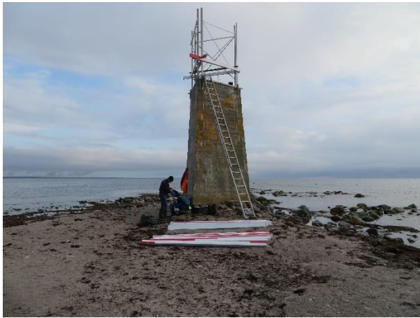
Stativet på plats