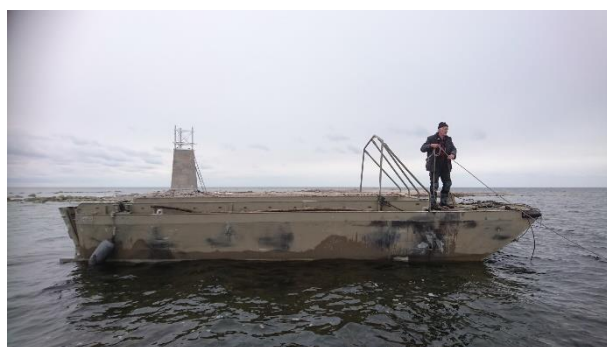
Lammprämen som användes för transporten