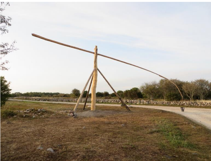
Vippen i nerfällt läge