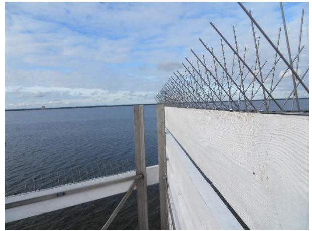
Fågelpinnar för att avskräcka skarvarna