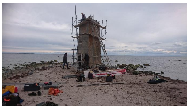
Byggnadsställningen rest på Austergrund

Hela konstruktionen monterades sedan isär och transporterades ut till Austergrund 2019-10-08