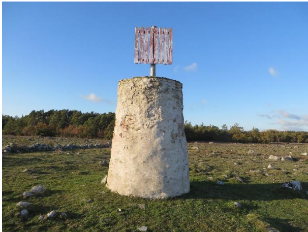
Kumlet innan renoveringen

Ansvariga för arbetena var Föreningen Tomtbods fiskeläge.