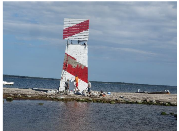
Målningen snart klar