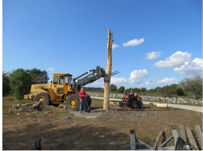
Resning av stammen